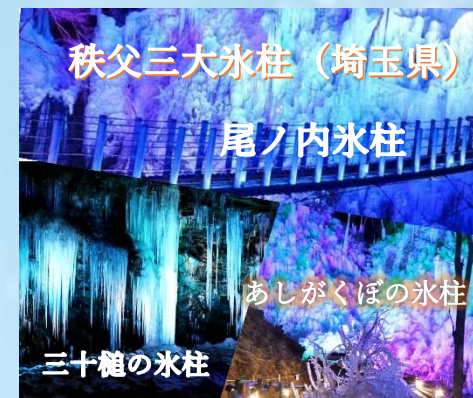
秩父三大氷柱(埼玉県)