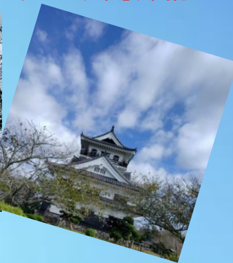
城山公園山頂にある三層四階天守閣形式の館山城

(八犬伝博物館)【昭和57年10月31日開館】では、里見氏を題材にした『南総里見八犬伝』に関する各種資料の展示と、現在にまで続く八犬伝の人気を紹介しています。