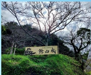
館山城(八犬伝博物館)

28年かけて物語を完成させた滝沢馬琴の実話 虚と実、2つの世界がシンクロする「八犬伝」映画化