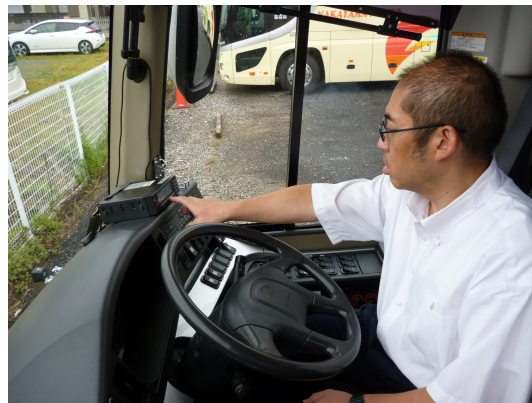
※運転席の各装置機能の使用方法を学ぶ