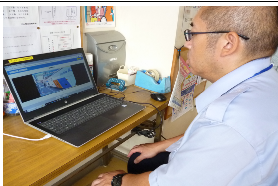
※ドラレコ視聴写真