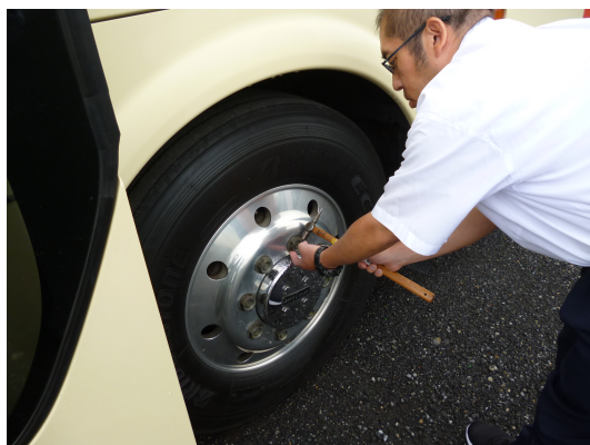
※日常点検方法を学ぶ